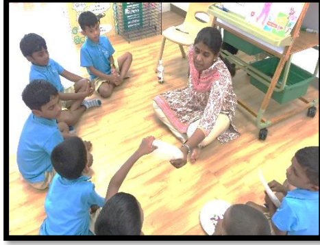
ஆசிரியர் பிள்ளைகளிடம் கேள்விகளைக் கேட்டுக் கலந்துரையாடுதல்